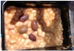
inklusive ab und an Schimmel oder Maden ...