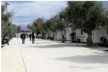
Kara Tepé Containerdorf für sehr vulnerable Flüchtlinge